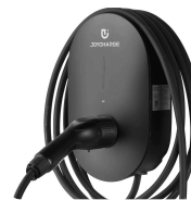
Wallbox Cargador de pared de 7,5W.